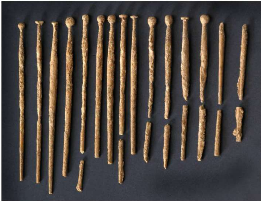
Fig. 7 - CAGLIARI - Area funeraria presso Piazza Repubblica. Gli spilloni ritrovati nella tomba 3