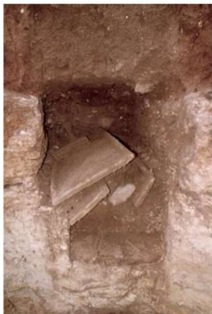
Fig. 5 - CAGLIARI - Area funeraria presso Piazza Repubblica. La tomba 3 al momento della scoperta e durante le fasi di scavo