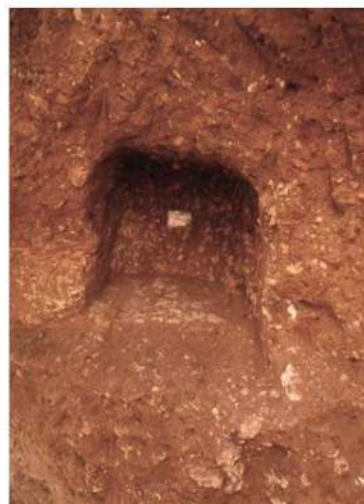
Fig. 4 - CAGLIARI - Area funeraria presso Piazza Repubblica. La tomba 2 al momento della scoperta e breve residuo della fossa