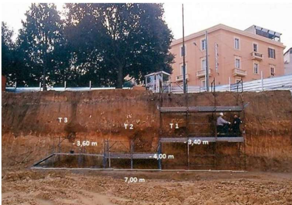
Fig. 2 - CAGLIARI - Area funeraria presso Piazza Repubblica. Veduta della parete con posizionamento delle sepolture e relative quote