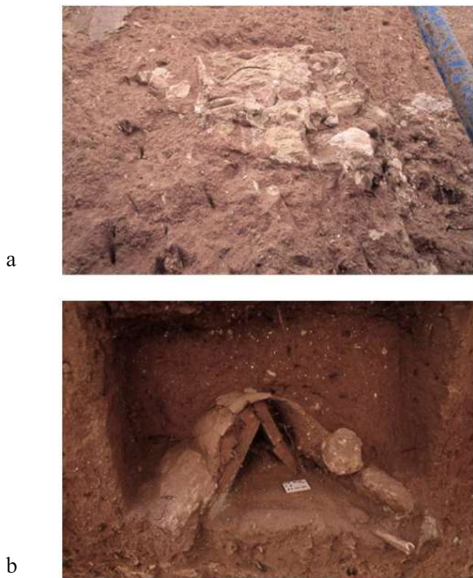
Fig. 3 - CAGLIARI - Area funeraria presso Piazza Repubblica. La tomba 1: a) sorta di copertura di pietre, fango e calce; b) la sepoltura con embrici alla cappuccina e copertura in calce