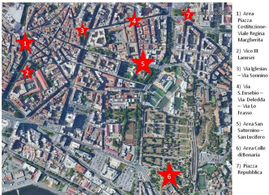
Fig. 8 - CAGLIARI. Localizzazione delle principali aree funerarie nel settore orientale della città (da Google Earth)